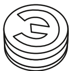
Рисунок 1. Изображение пломбы